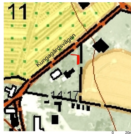
Figur 3. Del av fastighetskartan som visar schaktets läge.

Sammanlagt 43,34 m 2 upptogs med grävmaskin för ny avloppsledning från trekammarbrunn och ny infiltrationsbädd. Av dessa 43,34 m 2 utgjordes 10,39 m 2 av störningar i form av sentida nedgrävningar bland annat för den gamla avloppsanläggningen. I schaktet för infiltrationsbädden framkom två härdar varav den ena skadats i samband med ett sentida markingrepp. Parallellt med schaktningen genomfördes en skiktvis metalldetektoravsökning varvid endast moderna fynd framkom. Matjordstäcket var ca 0,5 m djupt.