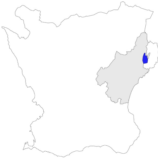
Figur 1. Karta över Skåne med Kristianstads kommun markerat med grått och Ivö socken med blått.