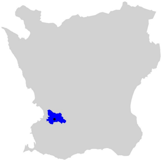
Figur 1. Karta över Skåne med Staffanstorps kommun markerat med blå färg och Staffanstorp med svart prick.