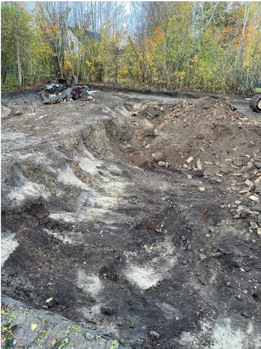
Figur 3. Rivningsmassorna i schakt 2. Det bruna i nedre delen av bilden utgörs av torvlager som visar att nedgrävningen stått öppen en längre tid innan den fyllts igen. Längs södra kanten av nedgrävningen förekom grundstenar.

Vid undersökningen påträffades ytterst få fynd. Några få skärvor av sent yngre rödgods framkom som lösfynd vid schaktningen.