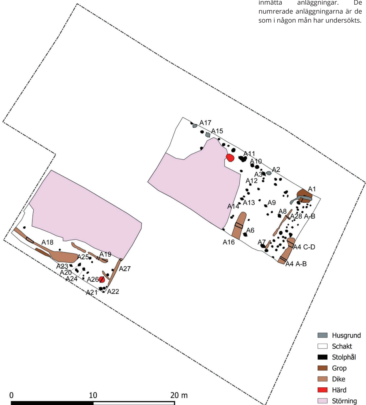
Figur 4. Schaktplan med samtliga inmätta anläggningar. De numrerade anläggningarna är de som i någon mån har undersökts.

ingått i en takbärande konstruktion. Anl. 6–9 undersöktes utifrån teorin att de kan ha ingått i den takbärande konstruktionen i ett stolpburet hus. Anl. 6–7 var kraftiga stolphål med ett djup av 0,4 m medan stolphålen anl. 8–9 var grundare. Topografin faller med ca 0,2 m och har man nivellerat marken för att få ett plant golv i huset så kan de fyra stolphålen ha varit ungefär lika djupa. Det framkom flera rännor/diken med okänd funktion. Anl. 16 var 0,48 m djupt och slutade abrupt. I fyllningen framkom endast tegelbitar. Parallellt med anl. 16 låg anl. 4 i vilken det också bara påträffades tegelbitar. Djupet i anl. 4 varierade dock jämfört med anl. 16 och låg mellan 0,12 och 0,32 m. Rännan, anl. 28, förefaller avgränsa ett stolphålsområde öster om rännan. Rännan var grund och blev partiellt bortschaktad. En del av rännan undersöktes där en liten tarm stack ut österut och här blev den nästan 0,3 m djup. En grop (anl. 1) undersöktes till