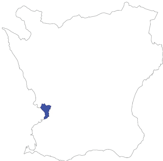
Figur 1. Karta över Skåne med Lomma kommun markerat med blått.