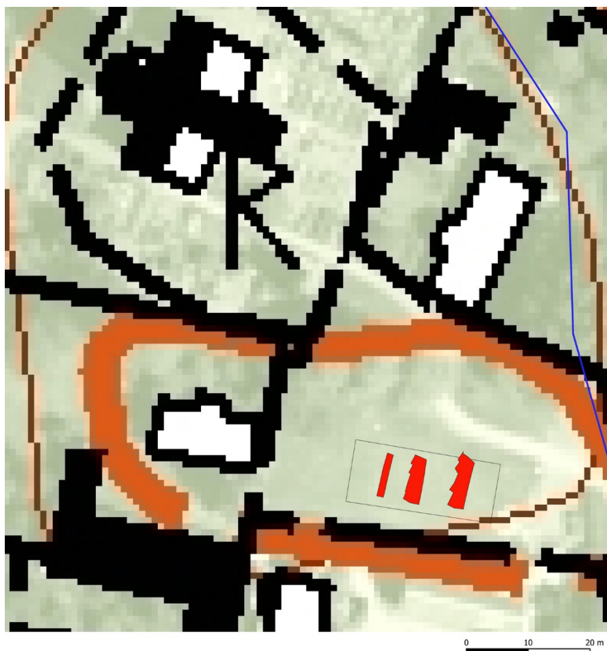
Figur 3. Del av fastighetskartan över Färingtofta. Färingtofta kyrka syns uppe till vänster i bilden. De tre schakten är markerade med rött. Fornlämningsbegränsningen för Färingtofta bytomt är markerade med blå linje (L1988:9578).

I och med att den underliggande topografin föll kraftigt mot sydost och man hade fyllt upp med jord och mycket sten bedömdes det inte som meningsfullt att dokumentera hela vaktmästeriets schaktyta.