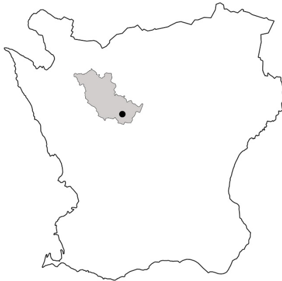
Figur 1. Karta över Skåne med Klippans kommun markerat med grått och Färingtofta kyrka med en svart prick.