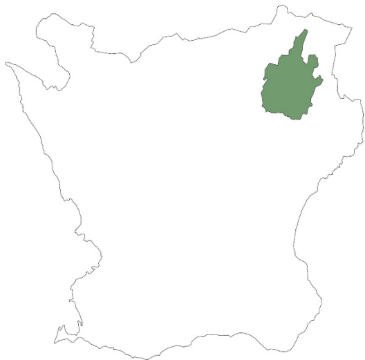
Figur 1. Karta över Skåne med Östra Göinge kommun markerat med grön färg.