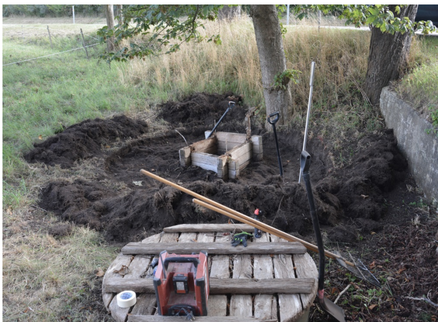
Figur 4. Fotot visar brunnen efter schaktning. Till höger i bild syns betongstödet och i förgrunden den sentida brunnen.