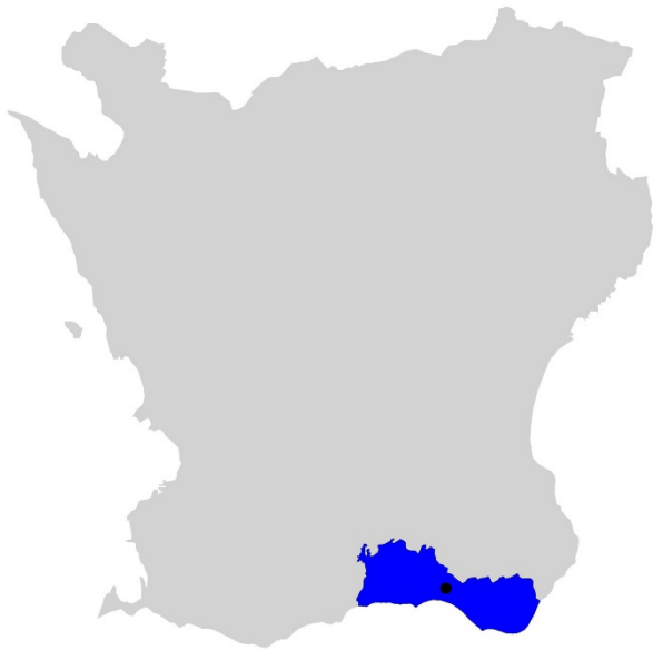
Figur 1. Karta över Skåne med Ystads kommun markerat med blått och Köpingsbro med svart prick.