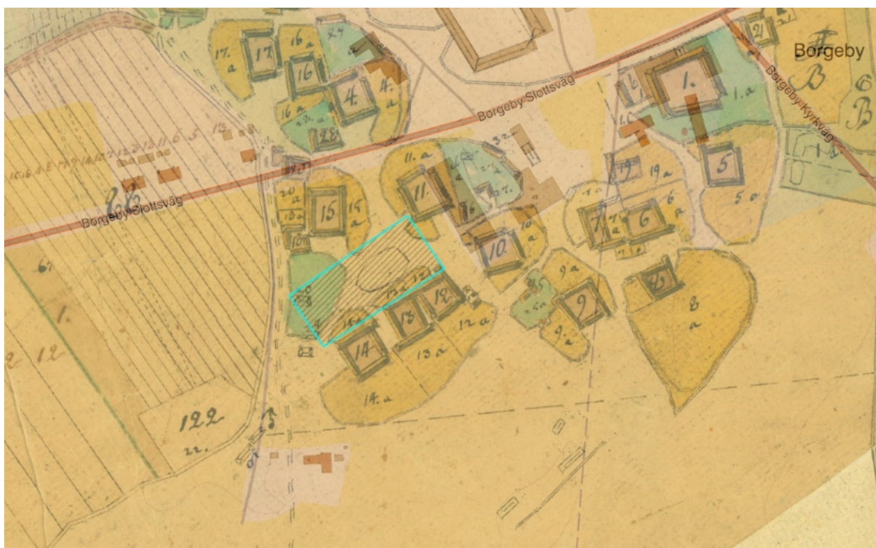
Figur 4. Undersökningsområdet inlagt på storskifteskartan från 1784 (Länsstyrelsen Skåne).

En fördjupad förundersökning bör genomföras för att bättre förstå lämningarnas vetenskapliga potential. En eventuell fördjupad förundersökning bör närmare undersöka de lämningar som framkom i östra delen av schakten 1–3 i syfte att förstå deras relation till de kända gårdslägena 10–11. Vidare bör stolphålsområdet väster om vanningen undersökas närmare för att se eventuella strukturer och ges en datering. Den eventuella dösen i schakt 4 bör också undersökas närmare för att avgöra om det rör sig om grundstenar efter en av gårdarna 12–14 eller verkligen är en dös.