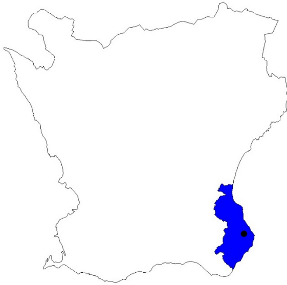
Figur 1. Karta över Skåne med Simrishamns kommun markerat med blå färg och Gladsax by med svart prick.