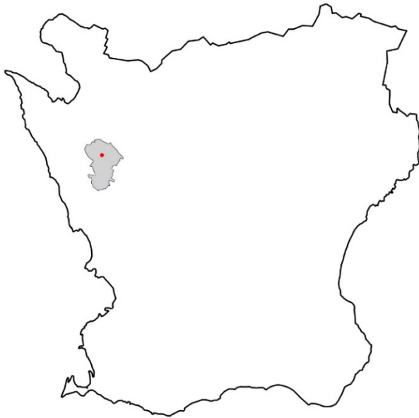
Figur 1. Karta över Skåne med Bjuvs kommun markerat med grått och Bjuvs samhälle med röd prick.