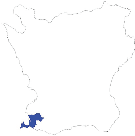
Figur 1. Karta över Skåne med Vellinge kommun markerat med blått.