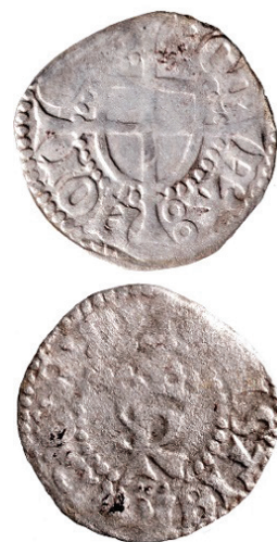
Figur 6. Vid metalldetekteringen påträffades en hvid som präglades under åren 1448–1481 i Malmö (LUHM 33239:3; F3). Skala 2:1.

Det framkom fyra mynt vid metalldetektoravsökningen. Samtliga mynt är präglade i Danmark under senmedeltiden. Det äldsta myntet är en hvid präglad under perioden 1448–1481 i Malmö under Kristian I regentperiod (LUHM 33 239:3). De tre andra mynten är präglade under Frederik I regentperiod och utgörs av tre söslingar, två är präglade i Köpenhamn 1524 (LUHM 33 239:1 & LUHM 33 239:5) och en i Ribe 1524–1526 (LUHM 33 239:4) (figur 3). Enligt Gitte Ingvardson har söslingarna alldeles för hög kopparhalt som om de vore förfalskningar. Förutom mynten påträffades en kniv och en tygklädd knapp. Kniven visade sig vid konserveringen vara i mycket dåligt skick. Ett något ovanligt fynd utgörs av den tygklädda knappen som framkom i kulturlagret (LUHM 33 239:7) (figur 8).