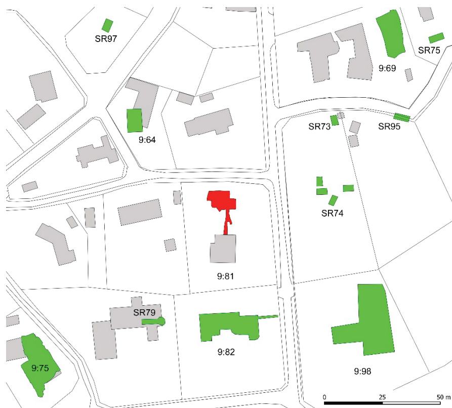
Figur 4. Kartan visar läget för de närmaste arkeologiska undersökningar som gjorts och som beskrivs i avsnittet Tidigare undersökningar.

År 2007 genomföres en arkeologisk förundersökning i form av en schaktningsövervakning inom den intilliggande fastigheten Falsterbo 9:82. Vid denna undersökning