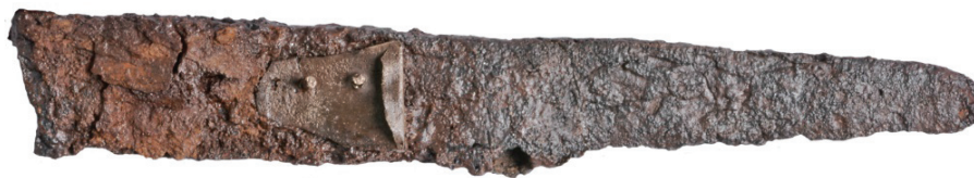
Figur 7. En kniv med delvis bevarat handtag (LUHM 33 239:6; F6). Skala 1:1.