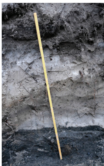
Figur 9. Figuren visar lagerbilden i kulvertschaktet. Fotot till vänster visar det mörka kulturlagret som framkom i botten av schaktet (sektionsfoto 1). Schaktbotten låg på 1,8 m ö.h. I figuren till höger syns början på det mörka kulturlagret men även två lerhorisonter som sannolikt är rester av golv (sektionsfoto 2). Schaktbotten låg på 1,6 m ö.h. Båda tumstockarna är utvecklade till en meter. Foto från öster.

Keramiken är liksom mynten huvudsakligen senmedeltida. Det har påträffats en större skärva från ett Siegburgkrus som har daterats till perioden 1400–1650, medan det exempelvis också finns en skärva från en jydepotta som dateras från 1500-talet till och med 1900-talet. Yngre vitgoods från Tyskland har daterats till perioden 1550–1650. Majoriteten av skärvorna från undersökningen utgörs emellertid av trebensgrutor i yngre glaserat rödgoods medan några skärvor från fat har inte framkommit. Det är därmed mest sannolikt att keramiken från undersökningen kan dateras till slutet av 1500-talet och möjligen början av 1600-talet.