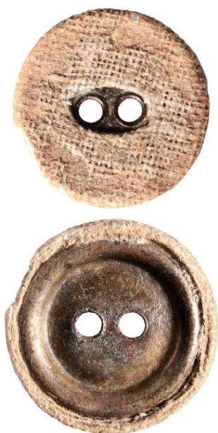
Figur 8. Tygklädd knapp av kopparlegering (LUHM 33 239:7; F7). Skala 3:1.

Den insamlade keramiken utgörs av 24 skärvor yngre rödgoods med en vikt av 277 g, tre skärvor yngre vitgoods med en vikt av 10 g, tre skärvor stengods med en vikt av 40 g, tre skärvor lergods med en vikt av 52 g och en skärva från en Jydepotta. Yngre rödgodset härrör enbart från trefotsgrutor och av inhemsk produktion. De tre skärvorna i glaserat vitgoods har tillhört en skål samt två obestämda kärl. Samtliga kärl har sannolikt haft en tysk proveniens och de kan dateras till perioden 1550 till 1650. De tre stengodsskärvorna kommer från samma krus och detta har tillverkats i Siegburg, nordost om Bonn i Tyskland. Kruset kan dateras från 1400 till mitten av 1600-talet. De tre skärvorna av lergods kan vara pottkakel men tolkningen är osäker. Skärvan från en Jydepotta kan dateras till slutet av 1500-talet och fram till 1900-talet (Brorsson 2023).