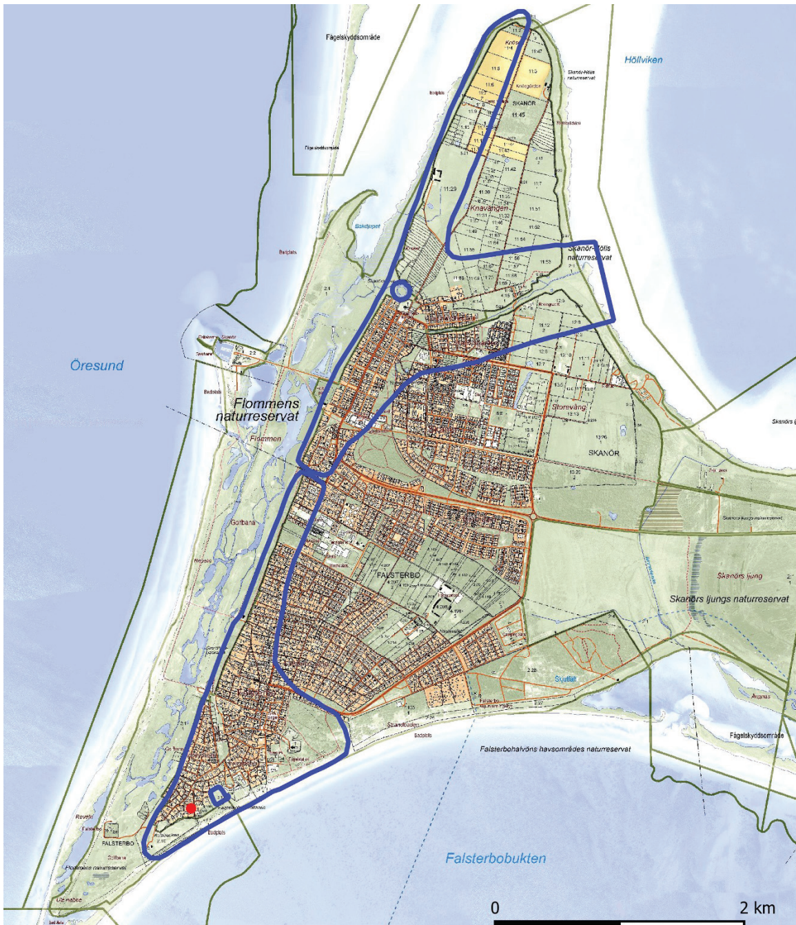
Figur 2. Del av fastighetskartan över Näset. Läget för undersökningen är markerat med rött. Fornlämningsbegränsningarna för Falsterbo och Skanör liksom respektive borganruiner är markerade med blå linje.