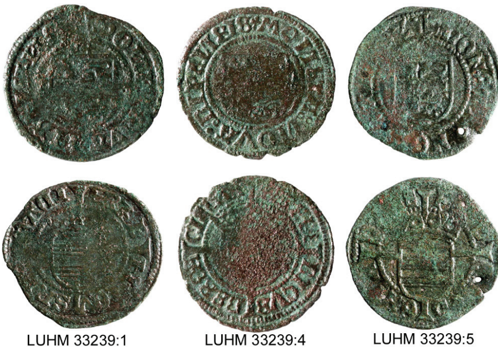
Figur 3. De tre söslingar som framkom vid metalldetekteringen. Skala 2:1.

De övre delarna av kulturlagret schaktades bort och i samband med detta genomfördes en skiktvis metalldetektoravsökning varvid fyra mynt, en tygklädd knapp, en musköt-kula och en kniv påträffades. Det förekom rikligt med yngre rödgods som i de flesta fall utgjordes av inhemsk tillverkning. Det påträffades även några skärvor yngre vitgods och stengods. I schakten framkom, förutom kulturlager, tre stolphål, en lerbotten (?), två gropar och ett dike samt rester efter lergolv och några grundstenar. Keramikens bör dateras till senmedeltid-tidig historisk tid.