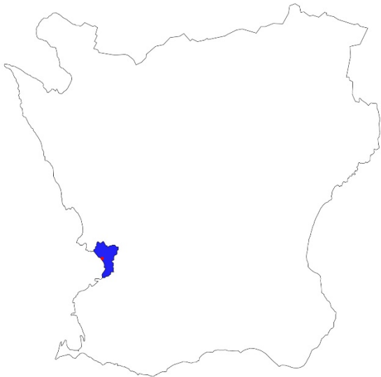
Figur 1. Karta över Skåne med Lomma kommun markerat med blå färg och platsen för undersökningen med röd punkt.