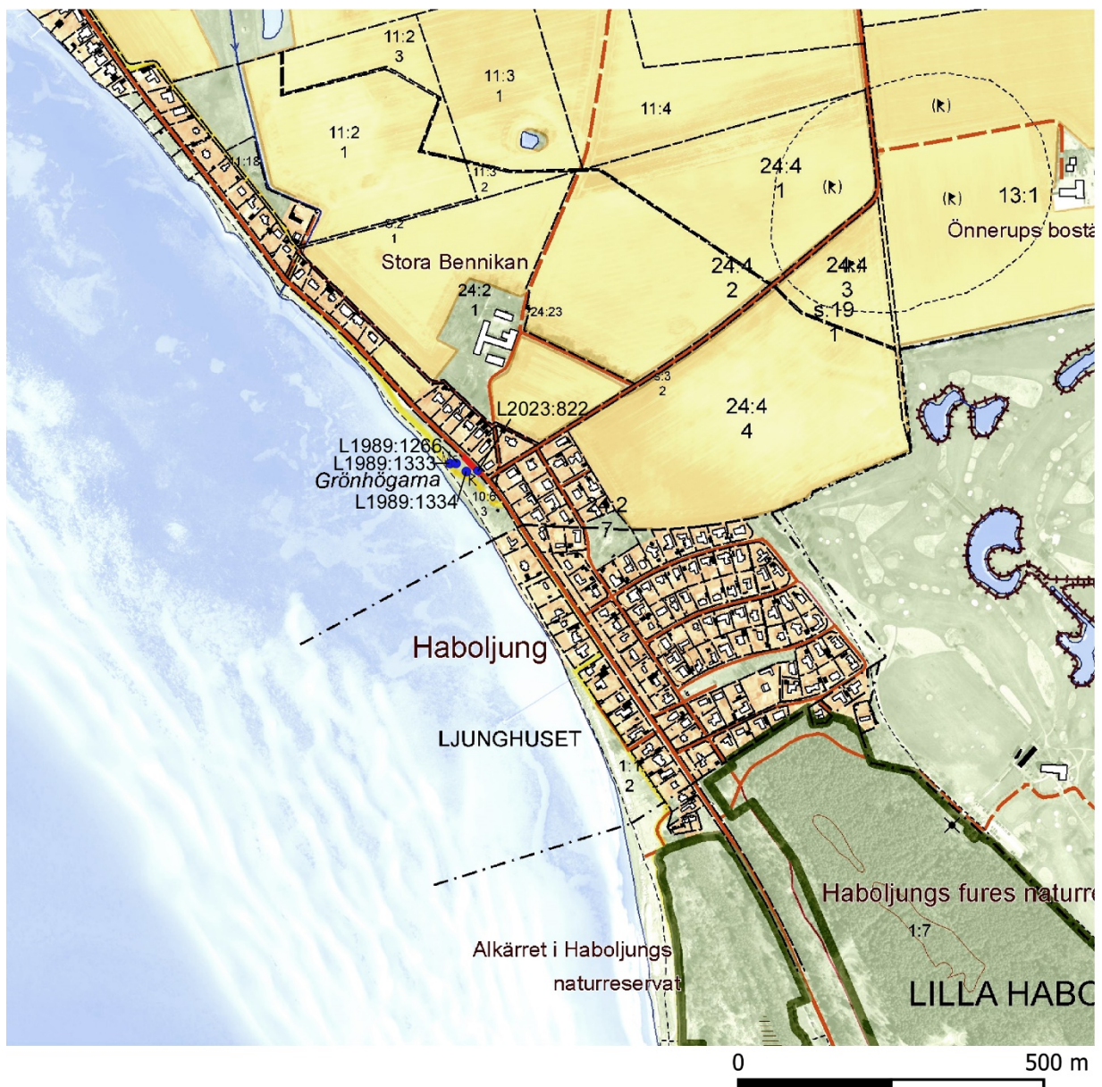
Figur 2. Del av fastighetskartan över Haboljung norr om Lomma. Undersökningsområdet är markerat med ett rött streck och fornlämningarna med blå prickar.