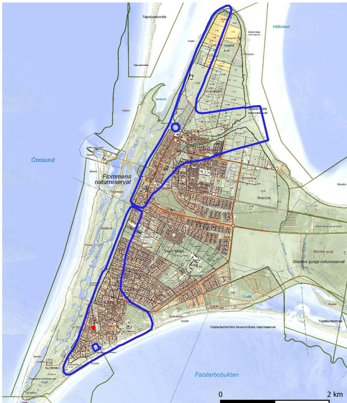
Figur 2. Del av fastighetskartan över Näset. Läget för undersökningen är markerat med rött. Fornlämningsbegränsningarna för Falsterbo och Skanör liksom respektive borgruiner är markerade med blå linje. ©Lantmäteriet