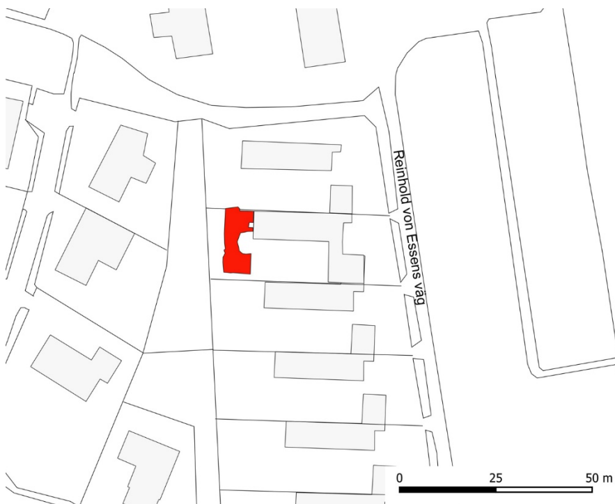
Figur 3. Figuren visar schaktets läge (rödmarkerat) och utsträckning. Bebyggelse är gråmarkerade

Vid metalldetektoravsökningen påträffades endast modernt skräp. Endast en bit medeltida keramik i form av en stengodsskärva från Siegburg framkom.