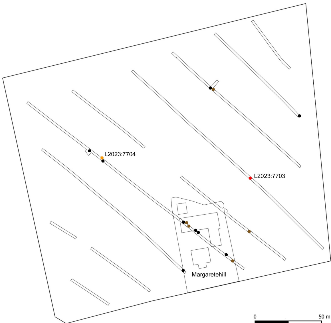
Figur 3. Schaktplan med samtliga schakt och anläggningar samt den rivna gården Margaretehill.

I den södra delen av undersökningsområdet har gården Margaretehill legat på en mindre höjd som fortsätter söder om undersökningsområdet. Bland de sentida resterna efter gården framkom anläggningar vars fyllning antyder att de är äldre än gården. Det kan vara så att denna höjd är den norra utkanten av en boplats som ligger söder om undersökningsområdet