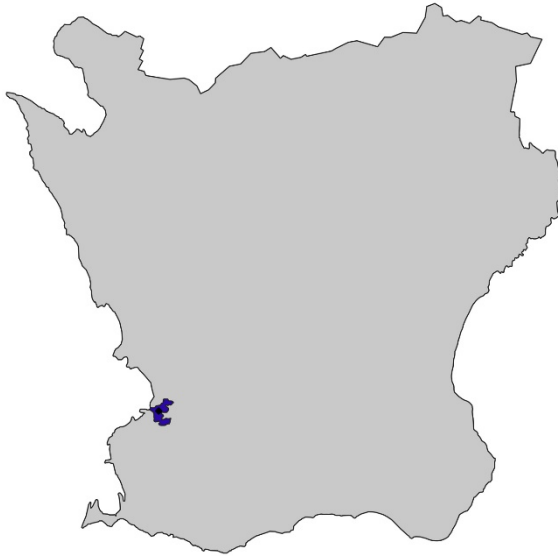
Figur 1. Karta över Skåne med Burlövs kommun markerat med blått.