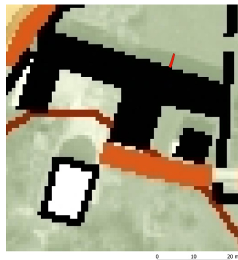
Figur 3. Det undersökta schaktet (rödmarkerat) inlagt på fastighetskartan.

I samband med undersökningen av gravarna genomförde Alf Ericsson en arkivstudie i syfte att försöka lokalisera den försvunna kyrkans läge. Efter en genomgång av skriftliga källor och historiska kartor menar Ericsson att det troliga läget för kyrkan har varit i södra utkanten av byn. Ericssons tolkning förefaller rimlig men innebär om kyrkogårdens norra begränsning har legat längs ekonomibyggnadens norra vägglinje så blir avståndet ca 40 m till kyrkan. Med beaktande av att byn inte varit så stor blir det väldigt mycket kyrkogård norr om kyrkan vilket var ett mindre attraktivt läge för begravningar. Man kan nog placera kyrkan något längre norrut utan att komma i konflikt med Ericssons tolkning.