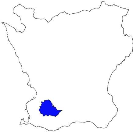
Figur 1. Karta över Skåne med Svedala kommun markerat med blå färg