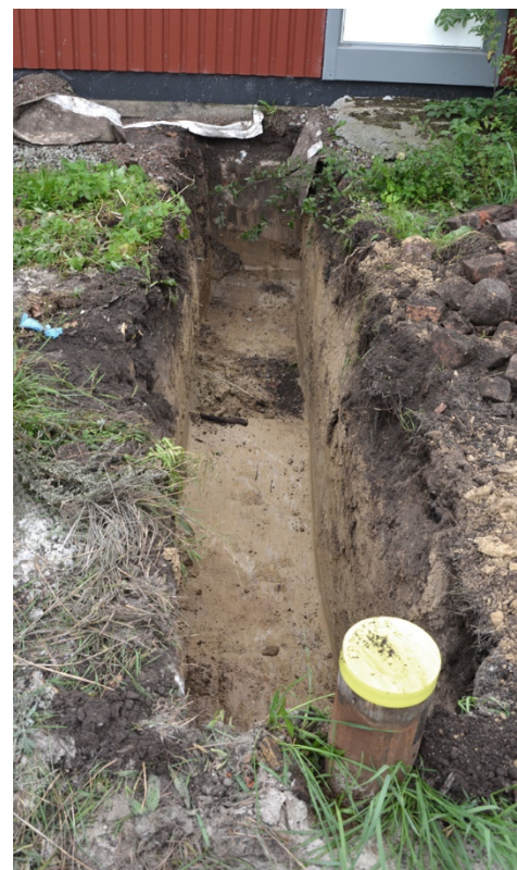
Figur 4. Fotot visar det undersökta schaktet. Foto från norr.