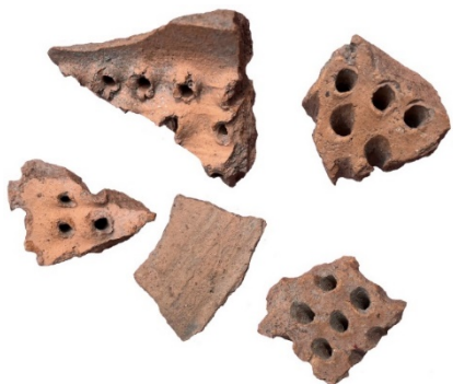
Figur 4. Fotot visar några exempel på keramikskärvorna från durkslaget. Skala 1:2.

Inga ytterligare arkeologiska insatser är motiverade så länge man håller sig till ett schaktdjup av 0,4 m och använder sig av befintliga ledningar till garaget.