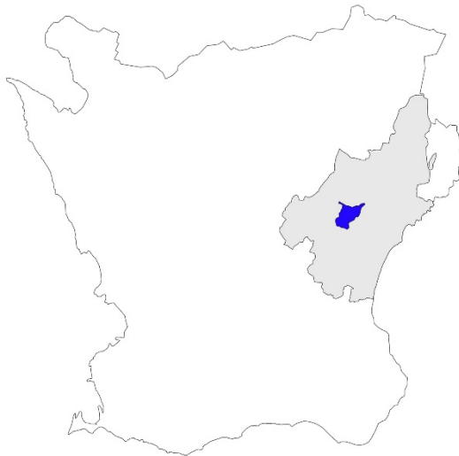
Figur 1. Karta över Skåne med Kristianstads kommun markerat med grått och Vä socken med blått.