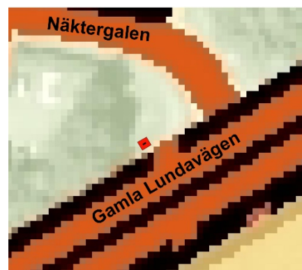
Figur 3. Vägmärkets nya placering på en grönyta mellan Gamla Lundavägen och Näktergalen. Fundamentet är markerat med rött och milstenen med svart.

Vägmärket har gjutits fast på sin nya placering varefter ett stenfundament har lavats upp. Stenen är något skadat i toppen sedan tidigare (se omslagsbild). Den nya placeringen är inmätt med en RTK-GNSS.