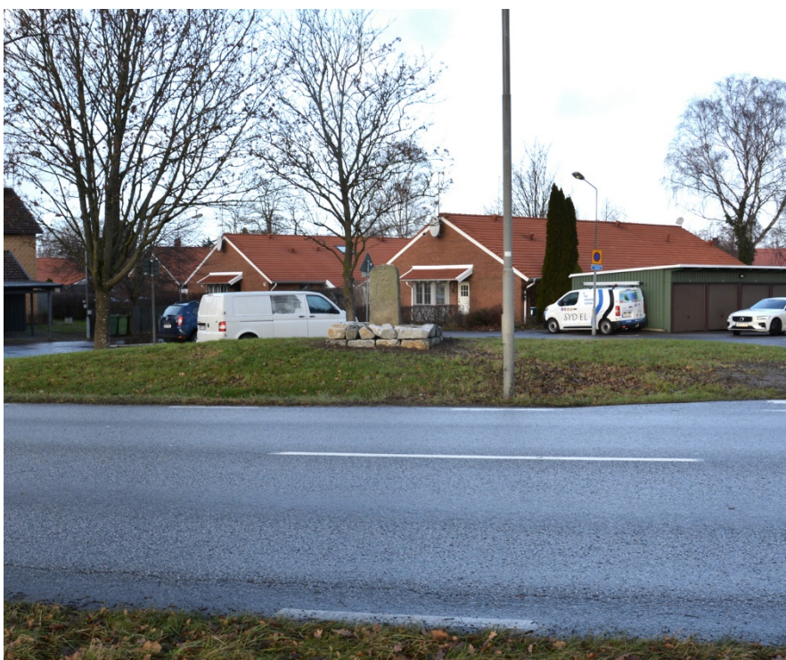
Figur 4. Vägmärkets nya plats sett från sydost om Gamla Lundavägen.