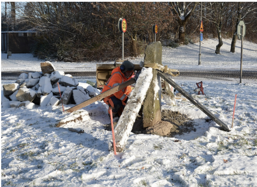
Figur 4. Vägmärkets har lyfts på plats och gjuts fast.