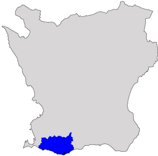
Figur 1. Karta över Skåne med Trelleborgs kommun markerat med blå färg och det ungefärliga läget för undersökningen med en svart prick.