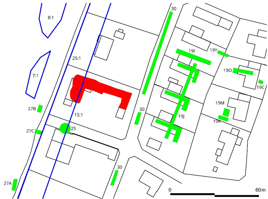
Figur 3. Karta som visar tidigare undersökningar (grönt). Numreringen hänför sig till Stadsarkeologiskt register. I FMIS registrerade fornlämningar är markerade med blått. Den aktuella undersökningen är markerad med rött. På kartan finns även det rivna huset inlagt.

förvaltning och kyrkoherde med säte i Skanör. Under 1800-talet är i själva verket Skanör och Falsterbo ingenting annat än kust byar med jordbruk och fiske för egen försörjning (Ersgård 1984, s. 10).