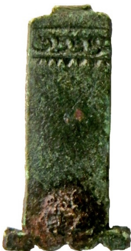
Figur 4. Beslag av brons eller koppar. Föremålet är 22 mm långt.

År 1936 framkom en gråstensmur strax söder om fastighetsgränsen för Falsterbo 8:13 (SR 25). Väster och sydväst om fastigheten framkom i tre schakt i samband med en undersökning 1972, kulturlager och en trätunna (SR 27A–C). År 1973 drogs 24 provschakt i kvarteret öster om fastigheten varvid det framkom kulturlager, svåmlager, lerbottnar och nergrävda trätunnor (SR 19A–Y). I samband med schaktningar 1976 i gatan omedelbart öster om fastigheten (Södra Fågelsträcket) framkom kulturlager, raseringslager, gårdsanläggning bestående avstensatt gårdsplan och korsvirkeslängor (SR 30).