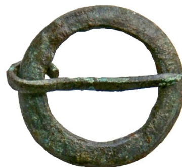
Figur 6-7. Övre bilden visar den delen av en sölja som fästs i remmen. Tillverkad av brons/koppar med en bredd av 20 mm. I nederdelen bildar den en cylinder i vilken resten av söljan har varit infäst. Tornen har stuckit ut genom springan. Nedre bilden visar en ringsölja av brons/koppar. Söljan har en diameter av 21 mm