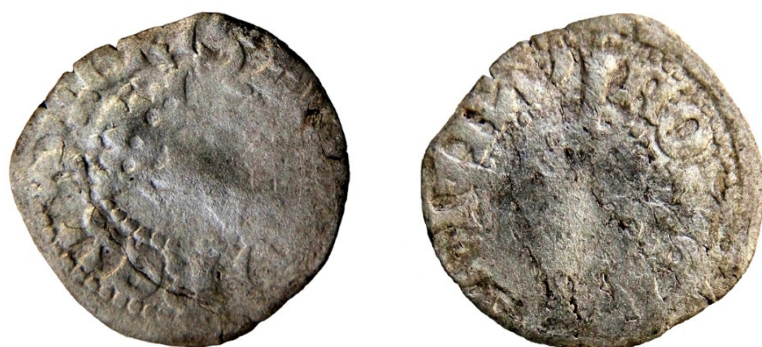
Figur 8-9. Myntet är en så kallad hvid, präglad i Malmö under Christian 1 (1448-1481) (LUHM 32708:1).