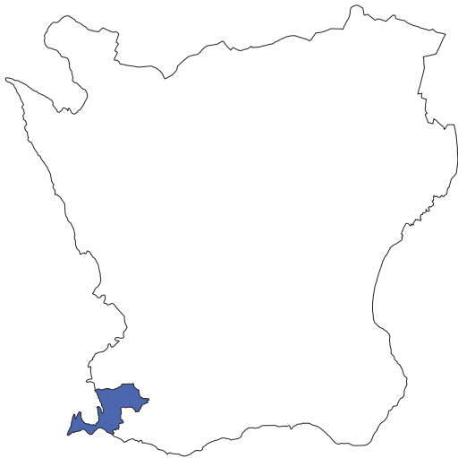
Figur 1. Karta över Skåne med Vellinge kommun markerat med blå färg.