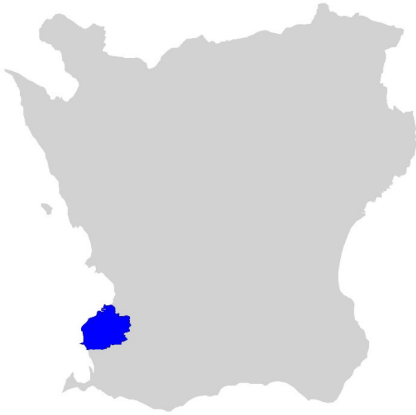
Figur 1. Karta över Skåne med Malmö kommun markerat med blå färg.