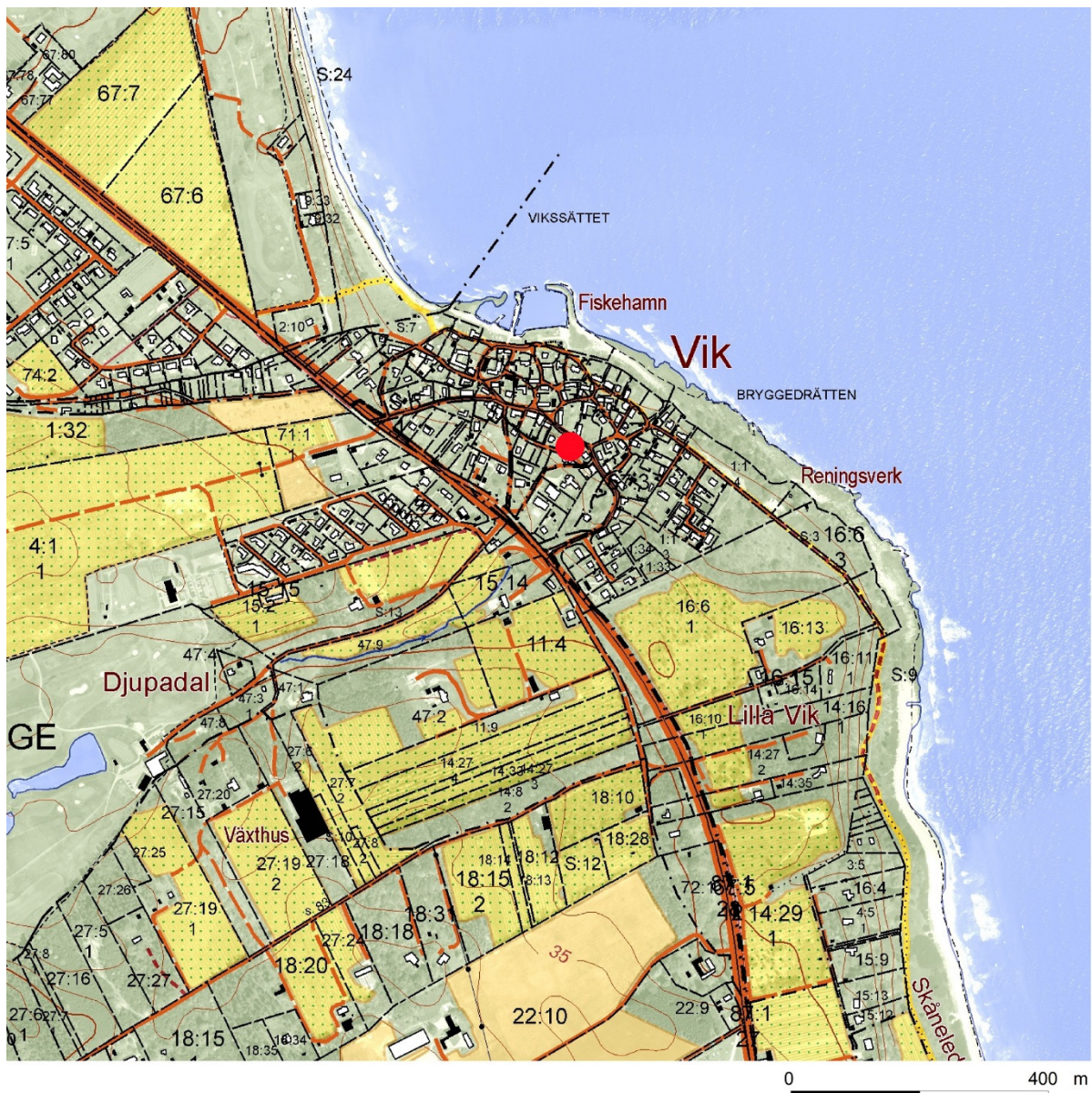
Figur 2. Utdrag ur fastighetskartan med undersökningsområdet markerat med rött.