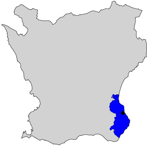
Figur 1. Karta över Skåne med Simrishamns kommun markerat med blå färg och Viks fiskeläge med svart prick.