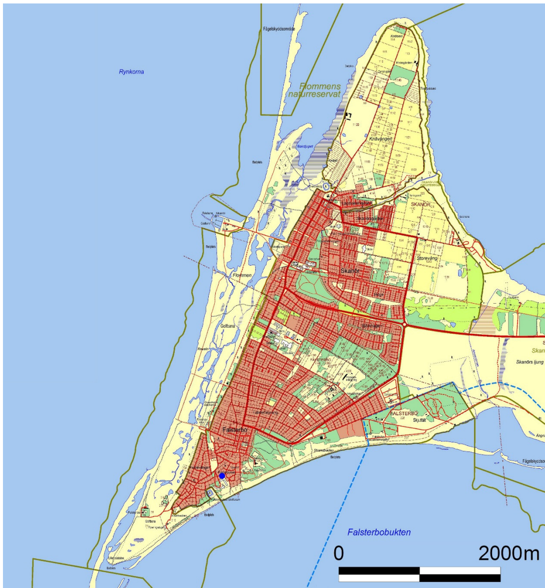
Figur 2. Karta över Näset med undersökningsområdet markerat med blå fylld cirkel. © Lantmäteriet