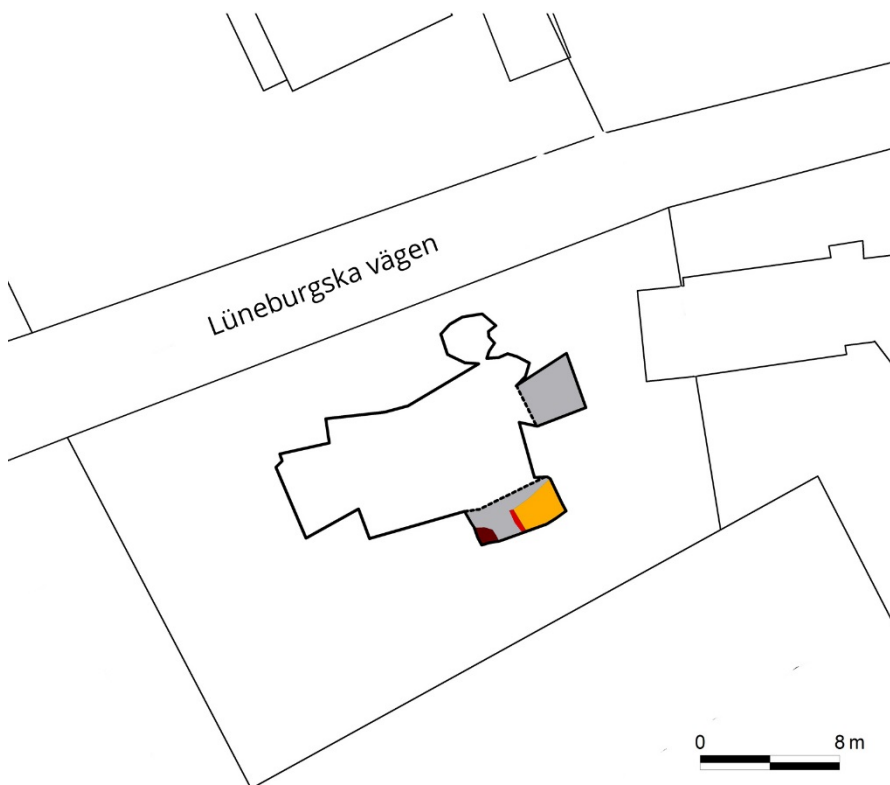
Figur 3. Schaktplan med det framschaktade kulturlagret (grått), lergolvet (gult), tegelväggen (rött) och gropen (brunt).

Fastigheten Falsterbo 9:93 ligger på en stor flygsandsdyn som sträcker sig i sydvästlig-nordostlig riktning under vilken rikligt med medeltida lämningar finns bevarade. Drygt 60 m öster om fastigheten (under samma flygsandsdyn) undersöktes under senhösten 2016 omfattande lämningar i form av kulturlager, lerbottnar, husrester, ugnar, nedgrävda silltunnor m.m. Dessutom framkom ett omfattande fyndmaterial av mynt. Materialet är ännu inte analyserat (Sarnäs under arbete).