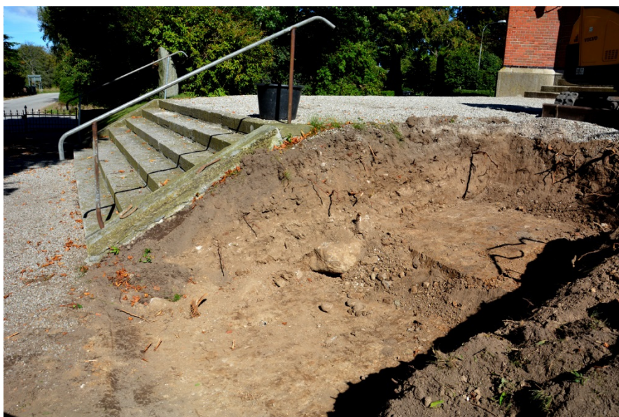
Figur 3. Foto från söder som visar schaktet och trappan på kyrkogården. I borte delen av schaktet skymtar stenar som troligen härrör från en tidigare trappa.

Tillgänglighetsanpassningen innebar bland annat att en ramp skulle anläggas söder om den befintliga trappan på kyrkogården. Den del av schaktet som övervakades var ca 8 m 2 stort med ett största djup av en knapp meter. I schaktet förekom påförda massor med få fynd av tegel. Endast ett fåtal små ben framkom. Den djupaste delen av schaktet nådde inte ned till ursprunglig marknivå. Det förekom inte några rivningsrester efter den äldre kyrkan. I norra schaktkanten, strax intill den befintliga trappan framkom en rad med kallmurade stenar som troligen härrör från en äldre trappa. Endast den djupaste schaktningen övervakades.