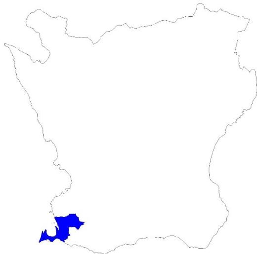
Figur 1. Karta över Skåne med Vellinge kommun markerat med blå färg.