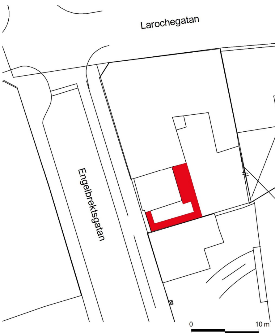
Figur 3. Schaktplan som visar schaktens läge (rödfärgade).

Markingreppet utgjordes av schaktning för ny grundsula samt omläggning av VA. Schakten för sulan var ca 0,8 meter djupa och berörde endast omrörda lager. Den södra delen av schaktet löpte längs ett hus med källare av murat tegel, vilket innebär att det bör ha funnits ett frischakt på ca 0,5 meter. Ett mindre schakt för byte av brunn nådde ett djup av ca 1,2 meter. Under brunnen fanns kulturlager bevarat.