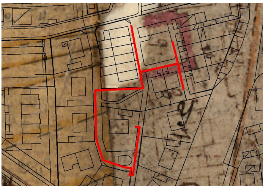
Figur 3. Schakten inlagda på enskifteskarta från 1804. Gård nr 9 syns till höger om det vita fältet i kartan. Skala 1:150.

Sammanlagt drogs 231 meter schakt med en bredd av 0,35–0,40 m och ett djup av som mest 0,6 meter. Schaktet drogs mestadels i gatumark. I norra delen framkom ett kulturlager som var 0,2 m där det var som tjockast. Inga fynd påträffades i lagret. Kulturlagret härrör sannolikt från gård nr 9 i Östra Skrävlinge by som låg kvar i byn efter enskiftet 1804 (figur 4-5). I övrigt berörde schakten mest omrörda lager som var lagda på fiberduk. Även kulturlagret var täckt med fiberduk.