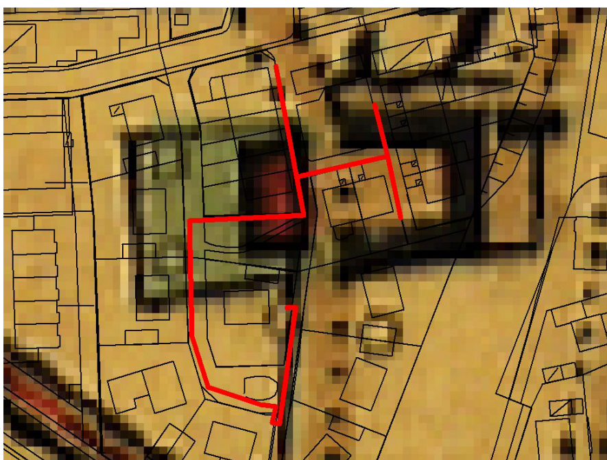
Figur 4. Schakten inlagda på Häradsekonomska kartan. Gård nr 9 ligger kvar i byn efter skiftet på samma plats som 1804. Skala 1:150.