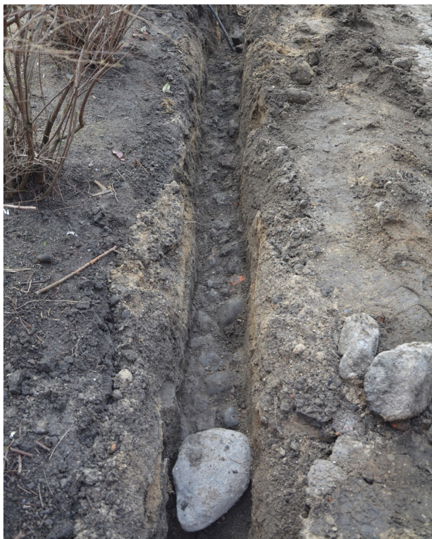
Figur 5. Foto över stenläggning. Fotot är taget från norr.