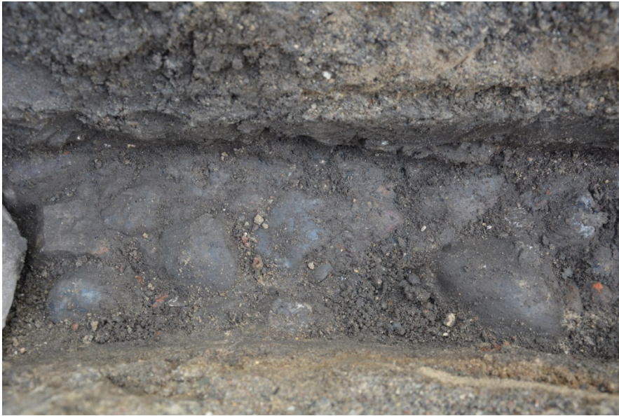
Figur 6. Närbild på stenläggningen. Den stora kantstenen skymtar i vänstra delen av bilden.