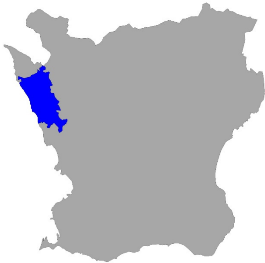
Figur 1. Karta över Skåne med Helsingborgs kommun markerad med blå färg.