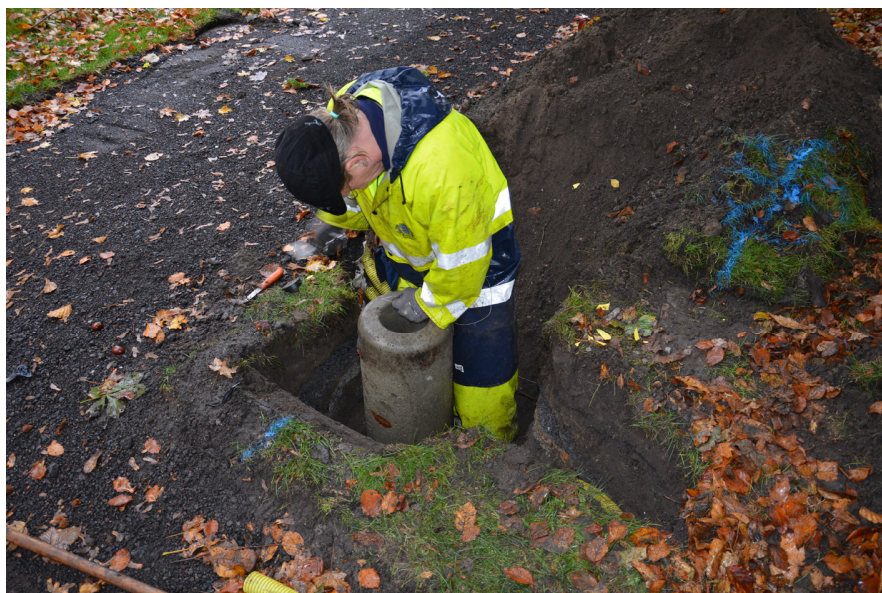
Figur 4. Placering av fundament för en av belysningsstolparna i en av groparna.

Denna gick ut på att den gamla staden skulle rivras och en ny byggas på utfyllda massor i Öresund. Ett nytt citadell skulle uppföras på ön Gråen, och en gigantisk stadsbefästning skulle byggas. Alla planer kom dock inte att förverkligas, men stora delar av staden samt stadskyrkan, S:t Johannis Baptistæ, revs. Arbetena gick långsamt. År 1768 konstaterade den skånska befästningskommissionen att projektet blivit mycket dyrare än beräknat. Med den dåvarande arbetstakten skulle det ta 342 år att färdigställa det nya Landskrona. De skulle i så fall vara färdiga år 2110. Trots detta fortsatte arbetena, för att i det närmaste avstanna år 1788. År 1805 sattes det officiellt stopp för utbyggandet av stadens försvar och 1822 betecknades Landskrona åter som ”öppen stad” (Jönsson 1993).