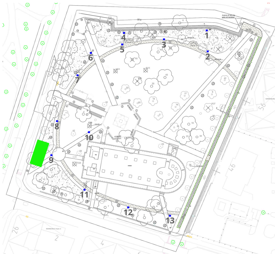
Figur 5. Karta över Stadsparken med provgroparnas läge. Den gröna rektangeln i kartans sydvästra del är det ungefärliga läget för 1946 års undersökning av Latinskolan. Det var i grop 9 som murresten framkom.

Ytterligare fyra gropar grävdes för belysningsstolpar i den nordöstra delen av Stadsparken. Dessa gropar övervakades inte då de hitintills framkomna resultaten inte motiverade detta. Enligt muntliga uppgifter från personal som ansvarade för arbetet så hade dessa gropar samma karaktär som de tidigare, dvs enstaka fynd av tegel och ben.