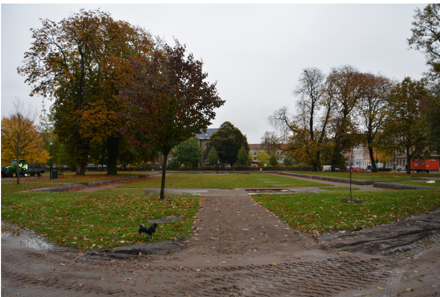
Figur 3. Grundmurarna efter den rivna Stadskyrkan, Sankt Johannes Baptistæ har markerats med sten.

En ny stadsplan för Landskrona fastställdes genom ett riksdagsbeslut år 1749.